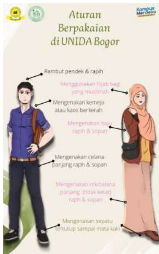
Gambar 1 Aturan berbusana bagi mahasiswa di lingkungan UNIDA